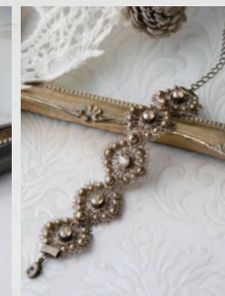
アンティーク ゴールド [2:7:0:0:5]