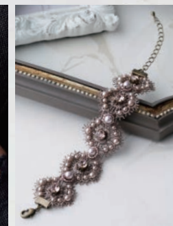
アンティークローズ [2:7:0:0:4]