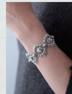
プラチナシルバー [2:7:0:0:3]