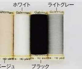
ホワイト ライトグレー