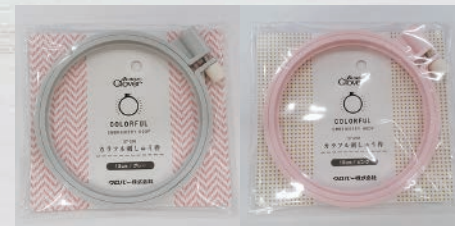
グレー [2:7:8:1:2] ピンク [2:7:8:1:3]

[8:1:0:5:3] リボン刺しゅうステッチ針 細タイプセット 標準価格 400円 (税別)