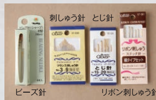
ビーズ針 リボン刺しゅう針

シルクオーガンジー ロール巻き (30cm×10m) 標準価格 7,400円 (税別)